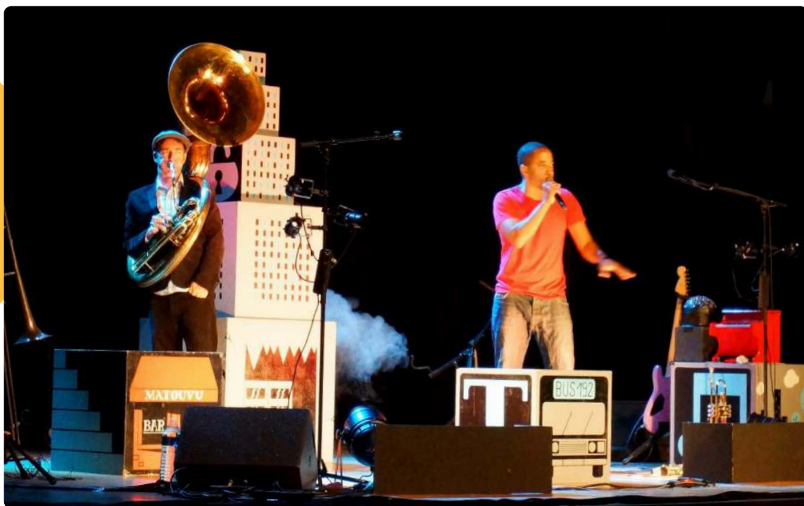
Décor de Panique au Bois Béton